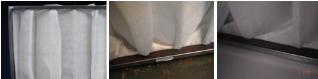
Moosgummi, Kleber, ungünstige Taschenöffnung