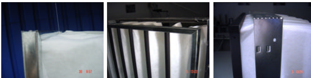
Filterform passgenau zum Aufnahmerahmen – schneller Einbau -