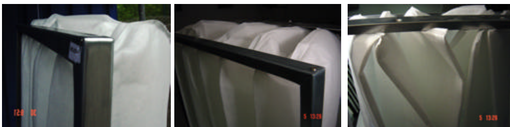
Filtermedium ragt über den Koprahmen hinaus – Korrekturausrichtung der Einzeltaschen manuell erforderlich -